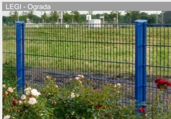
LEGI - Ograda

Ova konstrukcija je STABILNA zbog vrste veze LEGI stuba sa Vario L kapijom i specijalno patentirane LEGI cilindrične brave.